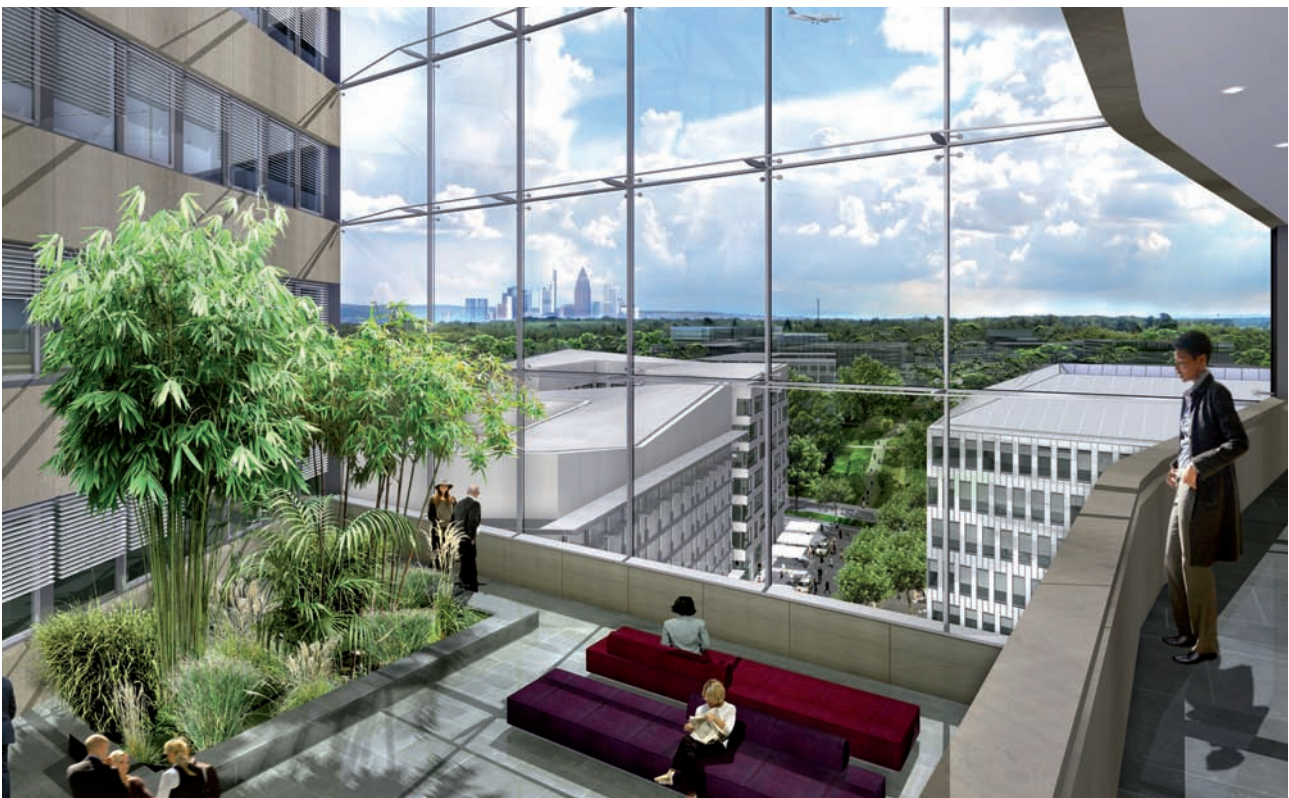
Blick in Richtung Quartier Alpha